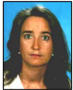
5 Dörschelln, Gonda PH-OP-ELB-QW, Geb. 302, T. 2816