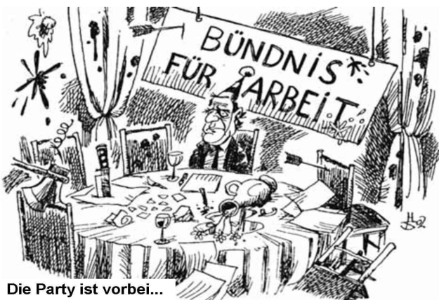
Die Party ist vorbei...

Der Elberfelder Betriebsrat hat bis jetzt dem neuen Werksausweis nicht zugestimmt. Aber das scheint nur noch Formsache zu sein, auch wenn die Elberfelder Betriebsvereinbarung noch nicht neu abgeschlossen wurde. Die Einsicht in die Unterlagen des Unternehmens, was mit dem neuen Ausweis alles gemacht werden kann und was geplant ist, wurde uns bisher verweigert. Das wird sicher auch seine Gründe haben, da auch die Betriebsratsmehrheit so geheimniskrämerisch damit umgeht. Dieses Vorgehen des Gesamtbetriebsrates und der Vertreter aus Elberfeld muss gestoppt werden. Im März wäre die Gelegenheit dazu.